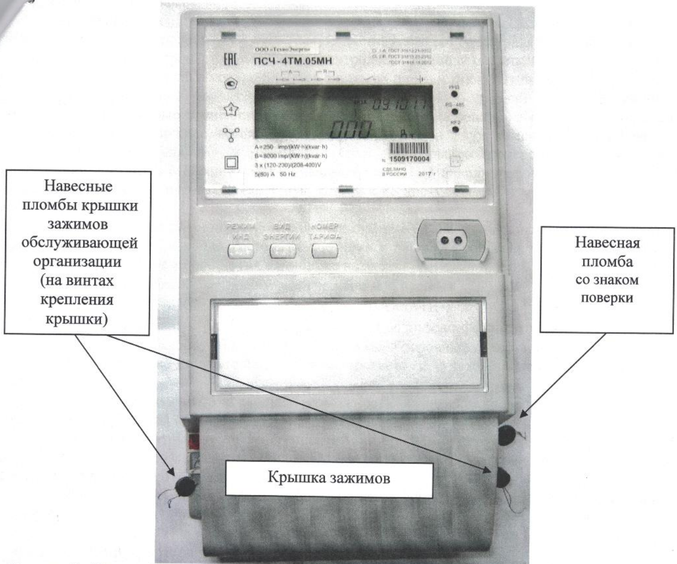
Рисунок 2 - Внешний вид счетчика внутренней установки с установленной крышкой зажимов, схема пломбирования от несанкционированного доступа, обозначение места нанесения знака поверки